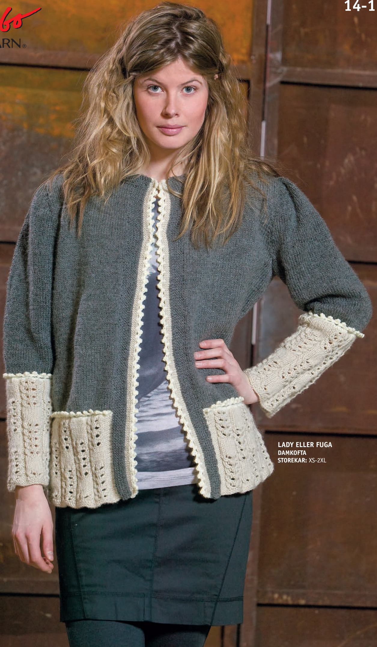
LADY ELLER FUGA DAMKÖFTA STOREKAR: XS-2XL