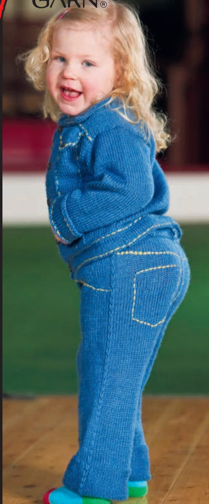
FUGA ELLER LADY MJUKIS JEANS & JEANSJACKA TILL BARN STORLEKAR: 68-110 cl