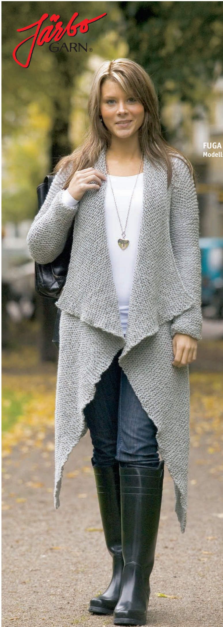
FUGA Modellstorlek M ca 750 g