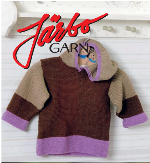
BABY PASCAL 86 cl Fg.1 ca 50 g Fg.2 ca 100 g fg.3 ca 100 g