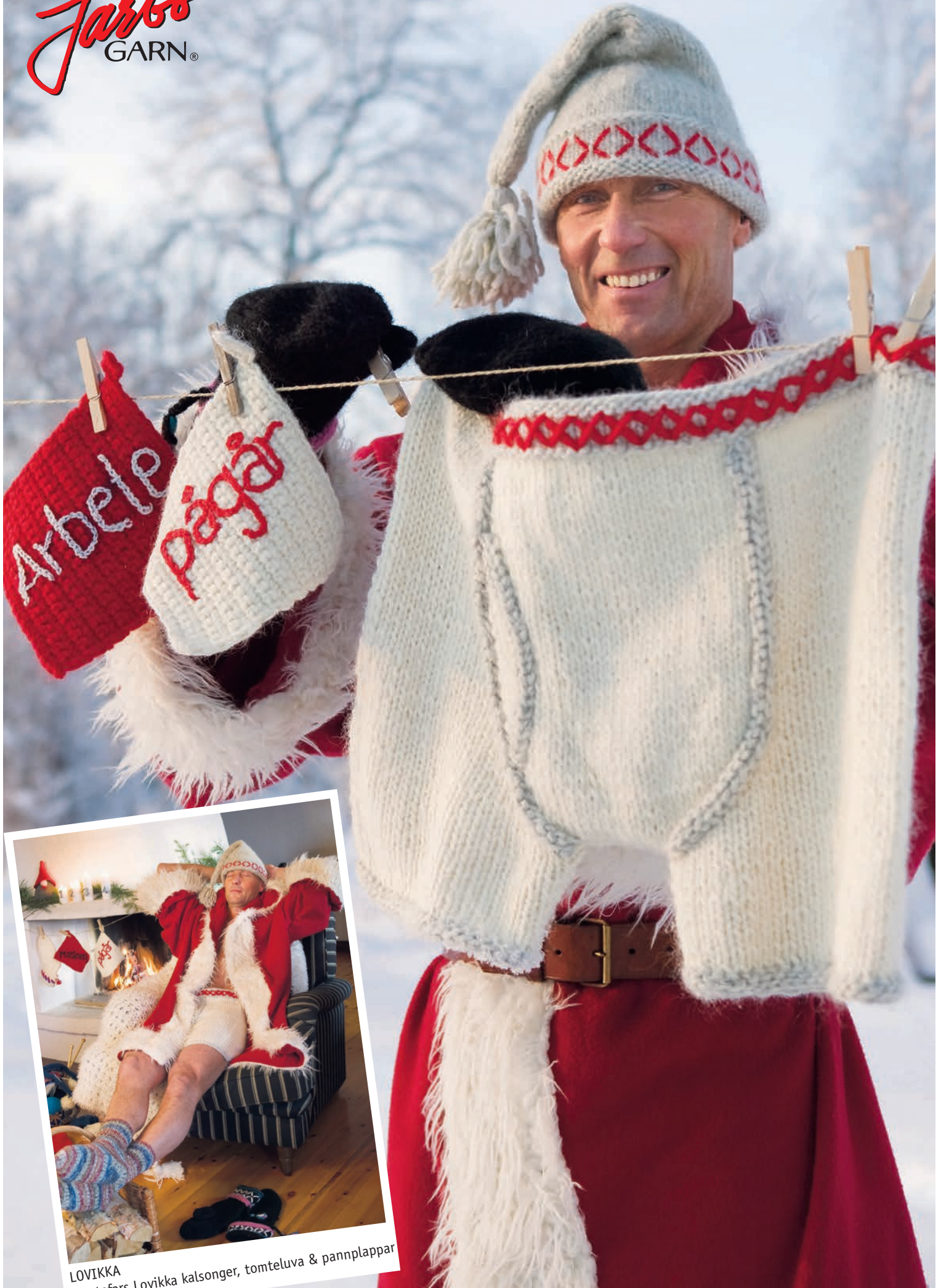
LOVIKKA Tomtefars Lovikka kalsonger, tomteluva & pannplappar