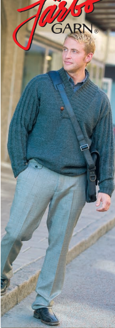
Gästrike 3 tr alt Fuga M ca 650 g