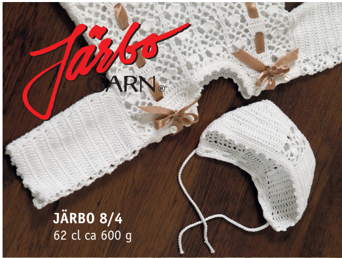
JÄRBO 8/4 62 cl ca 600 g