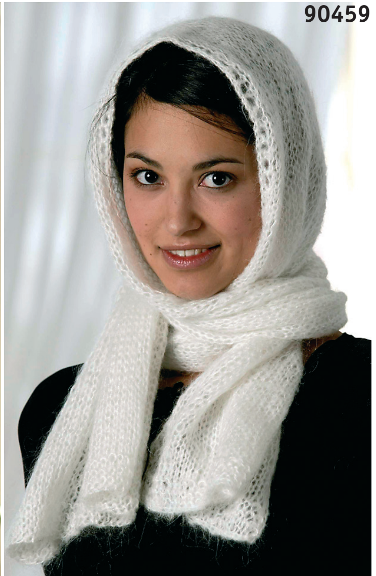
JÄRBO MOHAIR Knappschal 40 X 190 cm ca 100 g