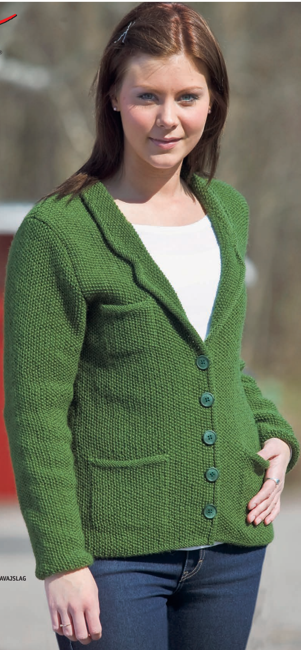
SAGA MOSSTICKAD JACKA MED KAVAJSLAG STORLEK: XS-2XL