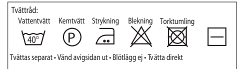
Diagrammet avser alla v

Design och beskrivning: Ingalill Johansson.